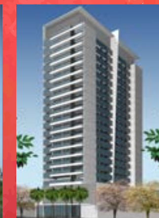
Ecco Tower - Guarulhos/SP