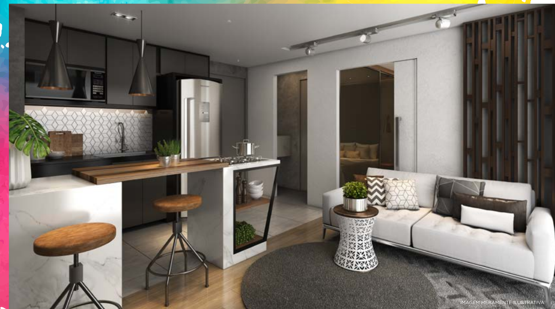
Perspectiva artística do living - sugestão Room Decor

Apartamento sugestão Room Decor - 1 Dormitório + Lounge Space. Ilustração artística do apartamento de 39,63m 2 . Todos os objetos estão dentro dos parâmetros comerciais e servem somente como sugestão de decoração. Nas perspectivas 3D o layout dos ambientes foram modificados como sugestão. O fechamento em vidro e cortina das sacadas, instalação de móveis externos e remoção/substituição de eventuais paredes e portas, estão sujeitos a prévia aprovação pelo condomínio em assembleia própria após a entrega do empreendimento.