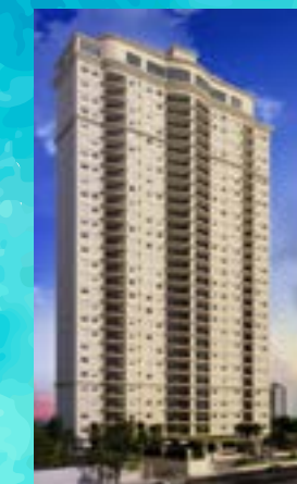
Bellagio - Alphaville/SP