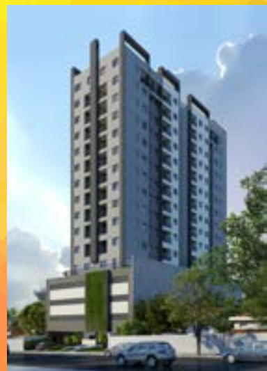
Residencial Estação 348 - Osasco/SP