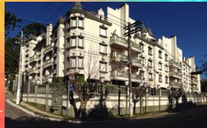
Chateau du Loire - Campos do Jordão/SP