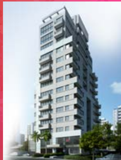
Smart Office - Alphaville/SP