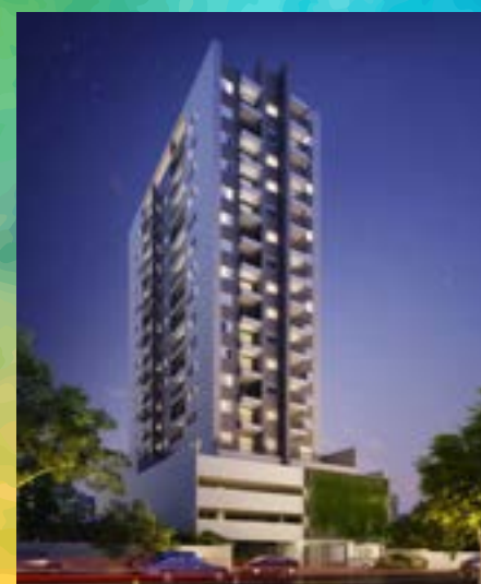
Residencial Estação 153 - Osasco/SP