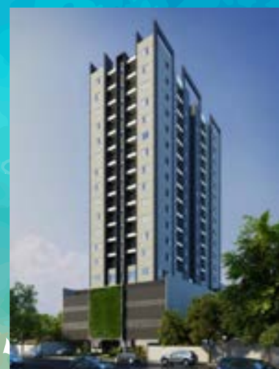
Residencial Estação 163 - Osasco/SP