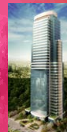
Air Office - Alphaville/SP