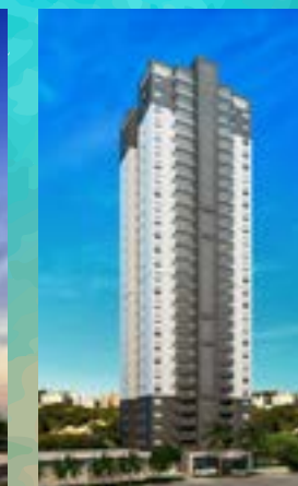
Soberano - Osasco/SP