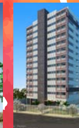
Plaza Office - São Paulo/SP