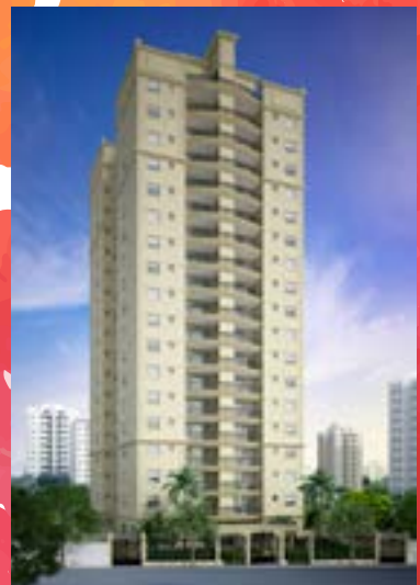
Waldorf Residence - Santana/SP