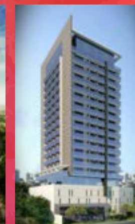
Campesina - Osasco/SP