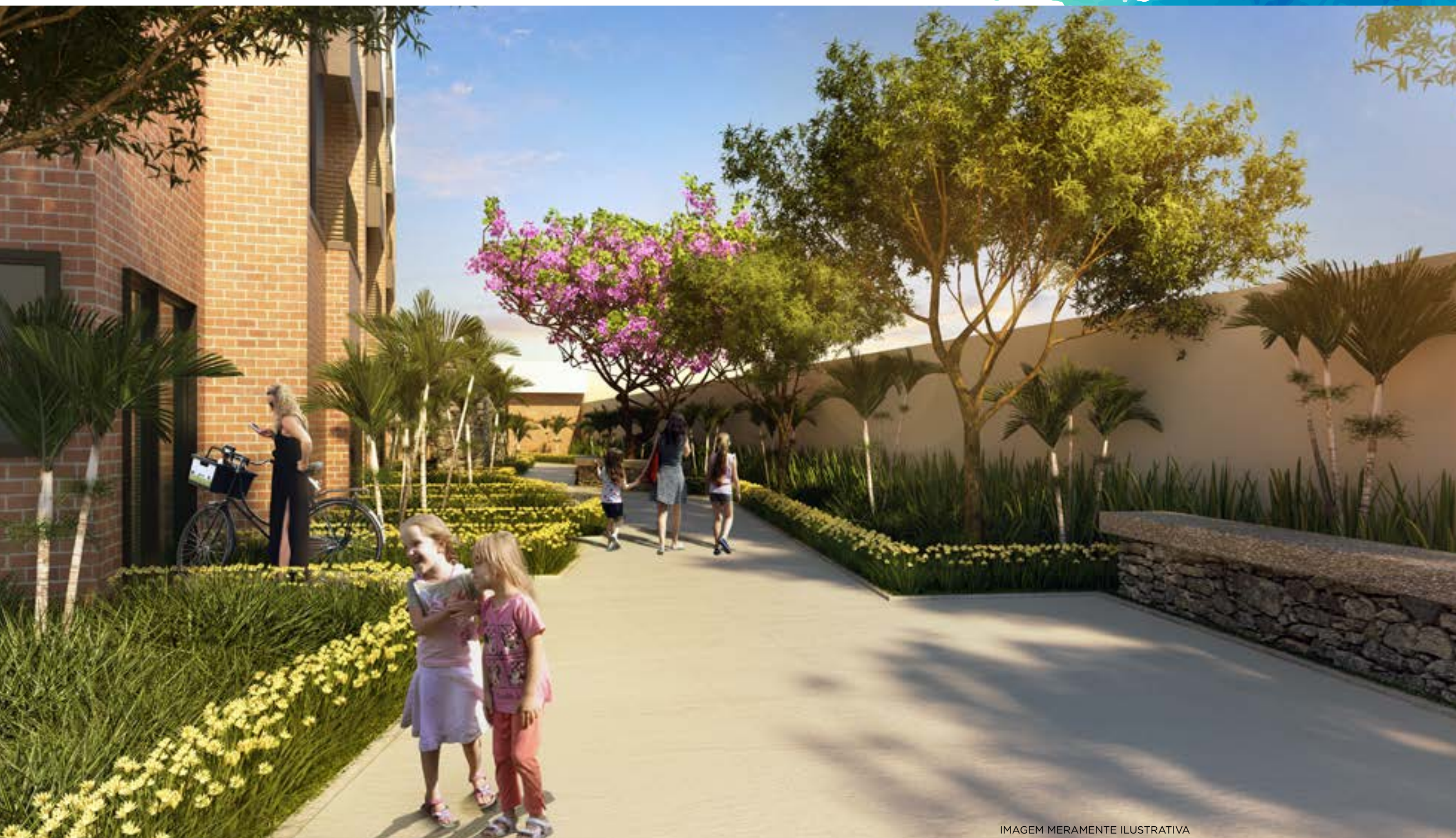
Área de convivência

Liberdade é poder aproveitar o que a vida tem de melhor.