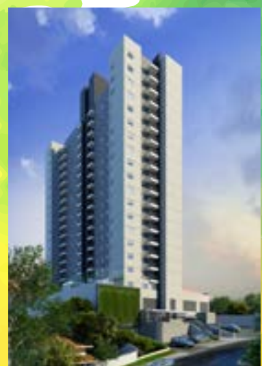
Urano Ecopark - Barueri/SP