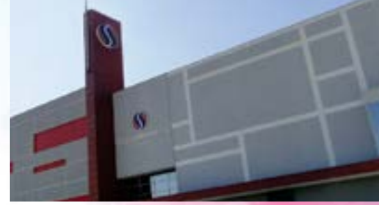
SUPER SHOPPING OSASCO