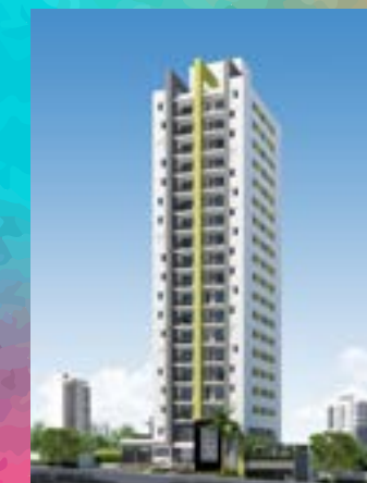
Mirante Rochdale - Osasco/SP