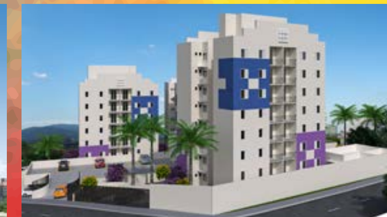
Vila Galli - Votorantim/SP