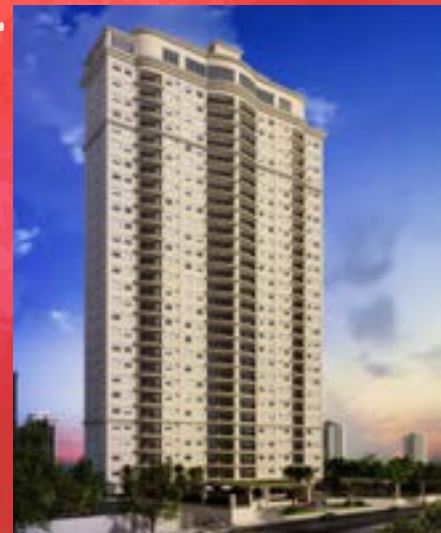
Bellagio - Alphaville/SP