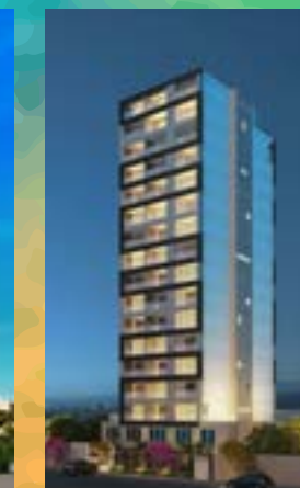
Stay - São Paulo/SP