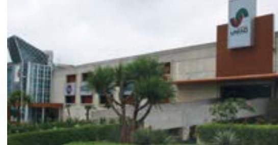
SHOPPING UNIÃO DE OSASCO