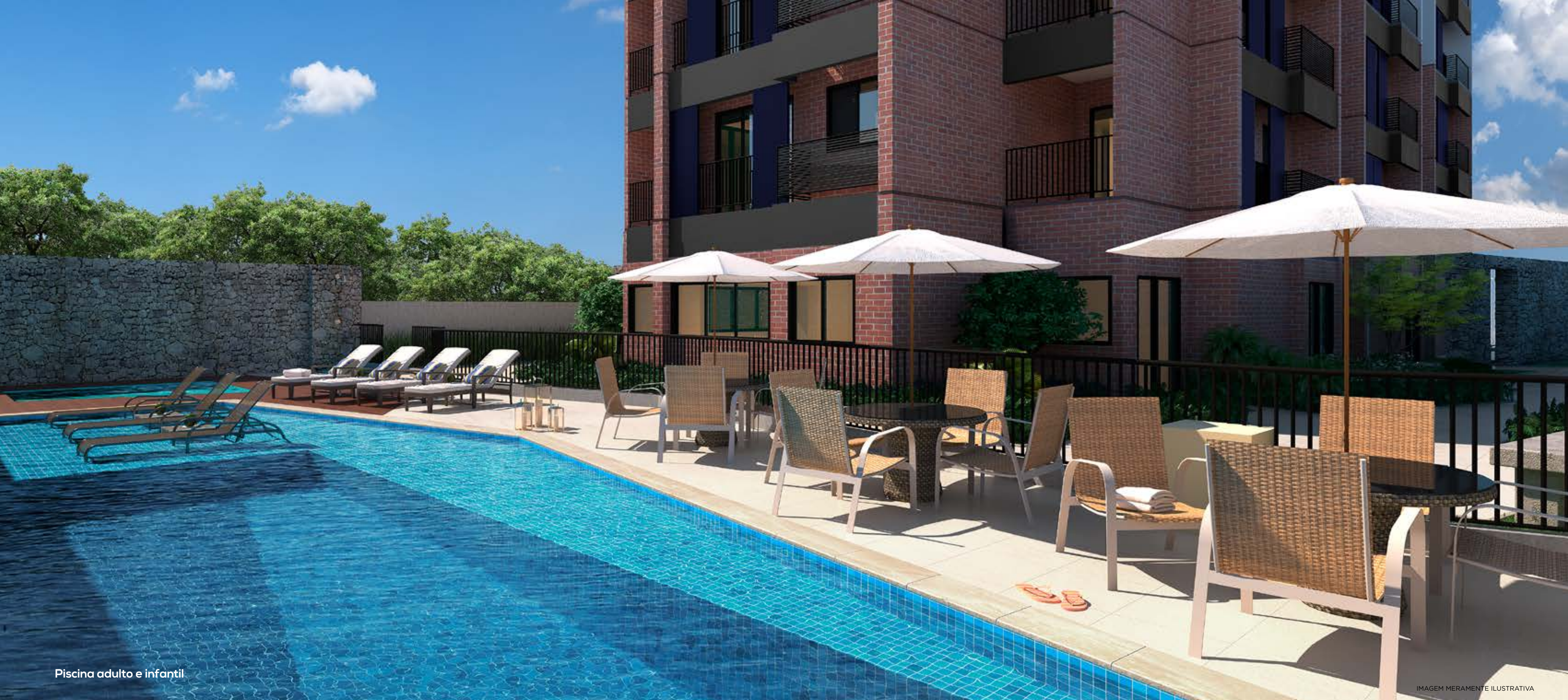
Piscina adulto e infantil