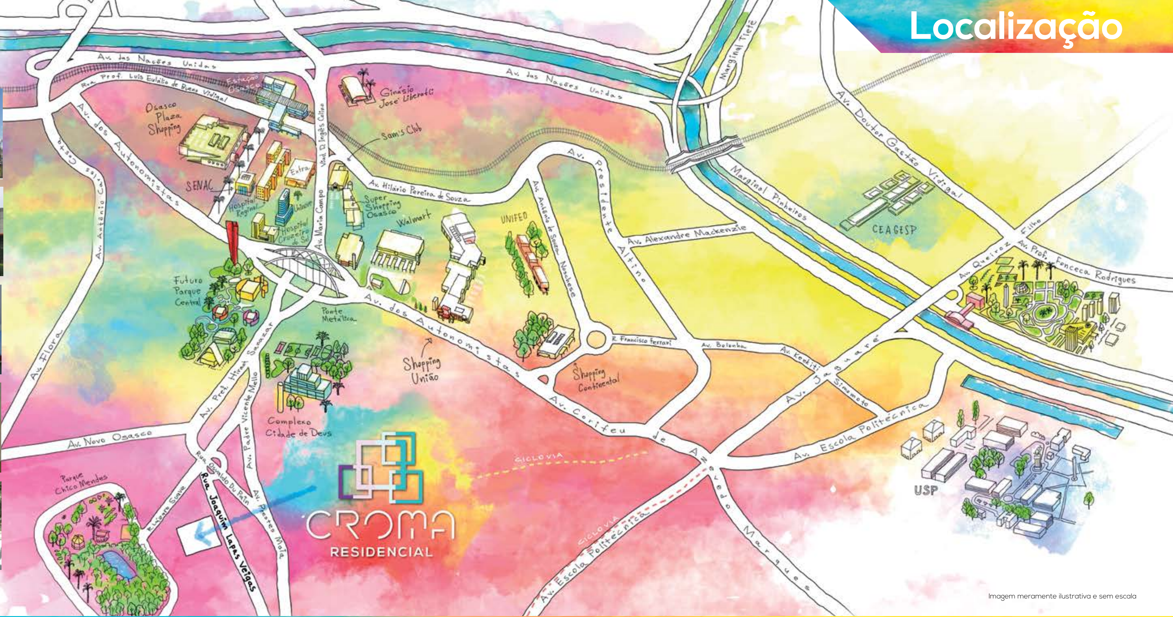
Imagem meramente ilustrativa e sem escala