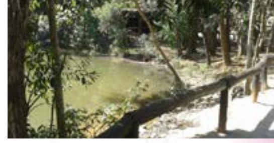
PARQUE CHICO MENDES