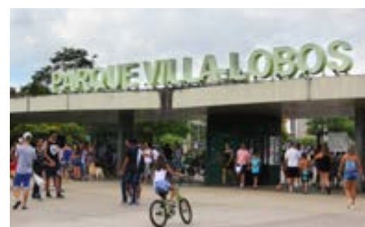
Parque Villa Lobos