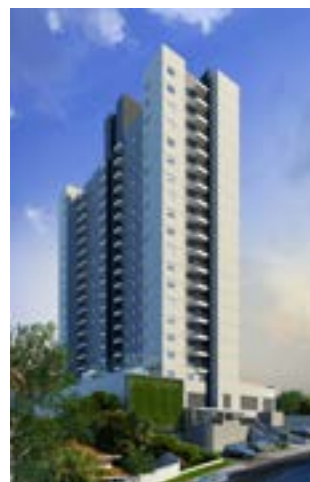
Urano Ecopark - Barueri/SP