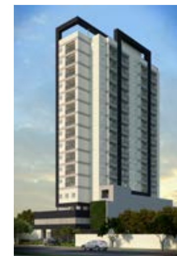
Residencial Estação 235 - Osasco/SP