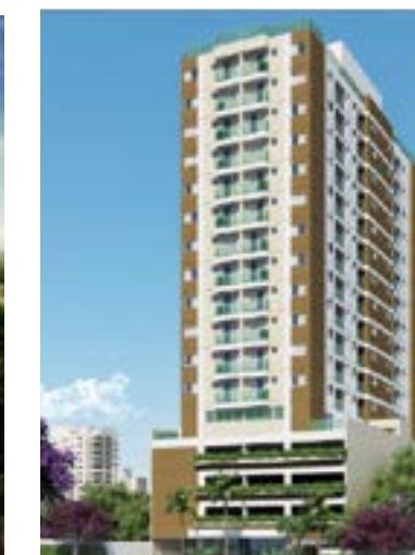
Brecheret - Osasco/SP