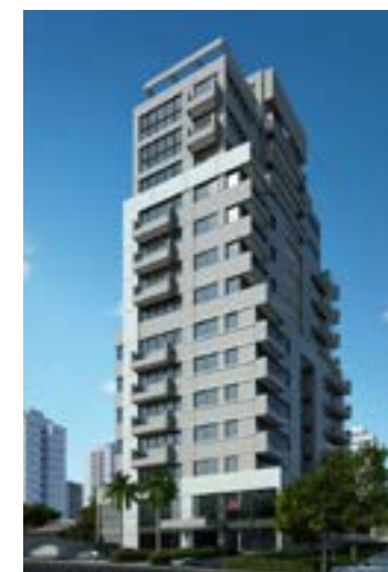
Smart Office - Alphaville/SP