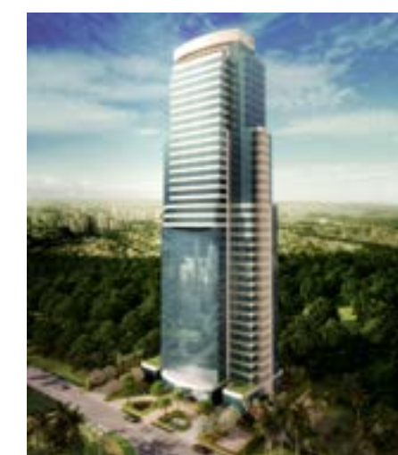
Air Office - Alphaville/SP