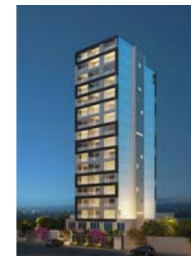
Stay - São Paulo/SP