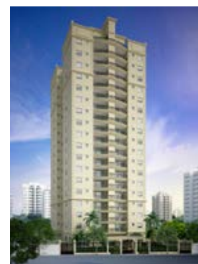
Waldorf Residence - Santana/SP