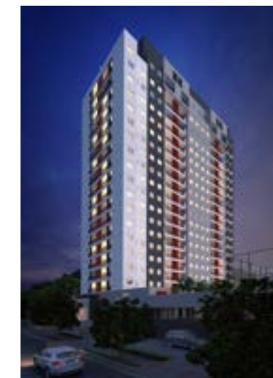
Estação 267 - Barueri/SP