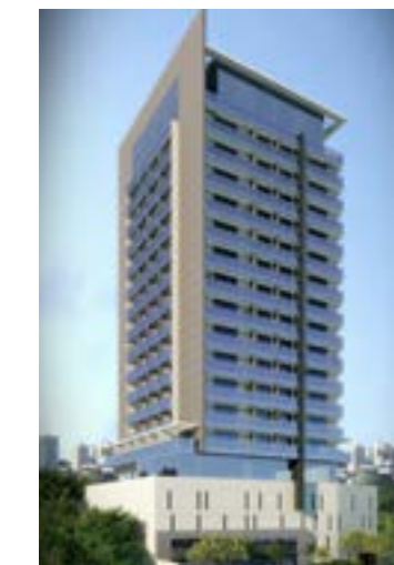
Campesina - Osasco/SP