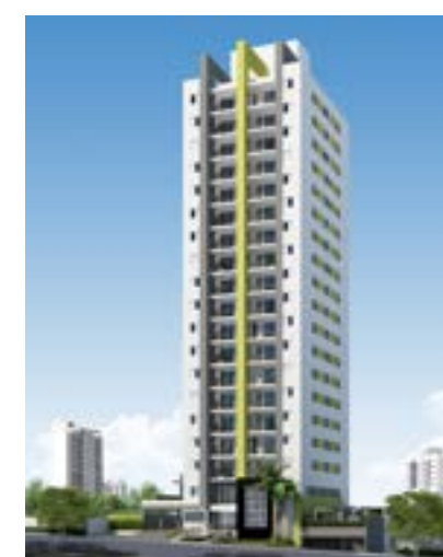
Mirante Rochdale - Osasco/SP