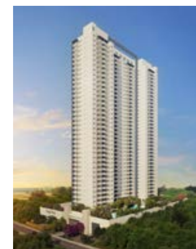
Acqua Park - Alphaville/SP