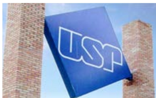
USP - Butantã