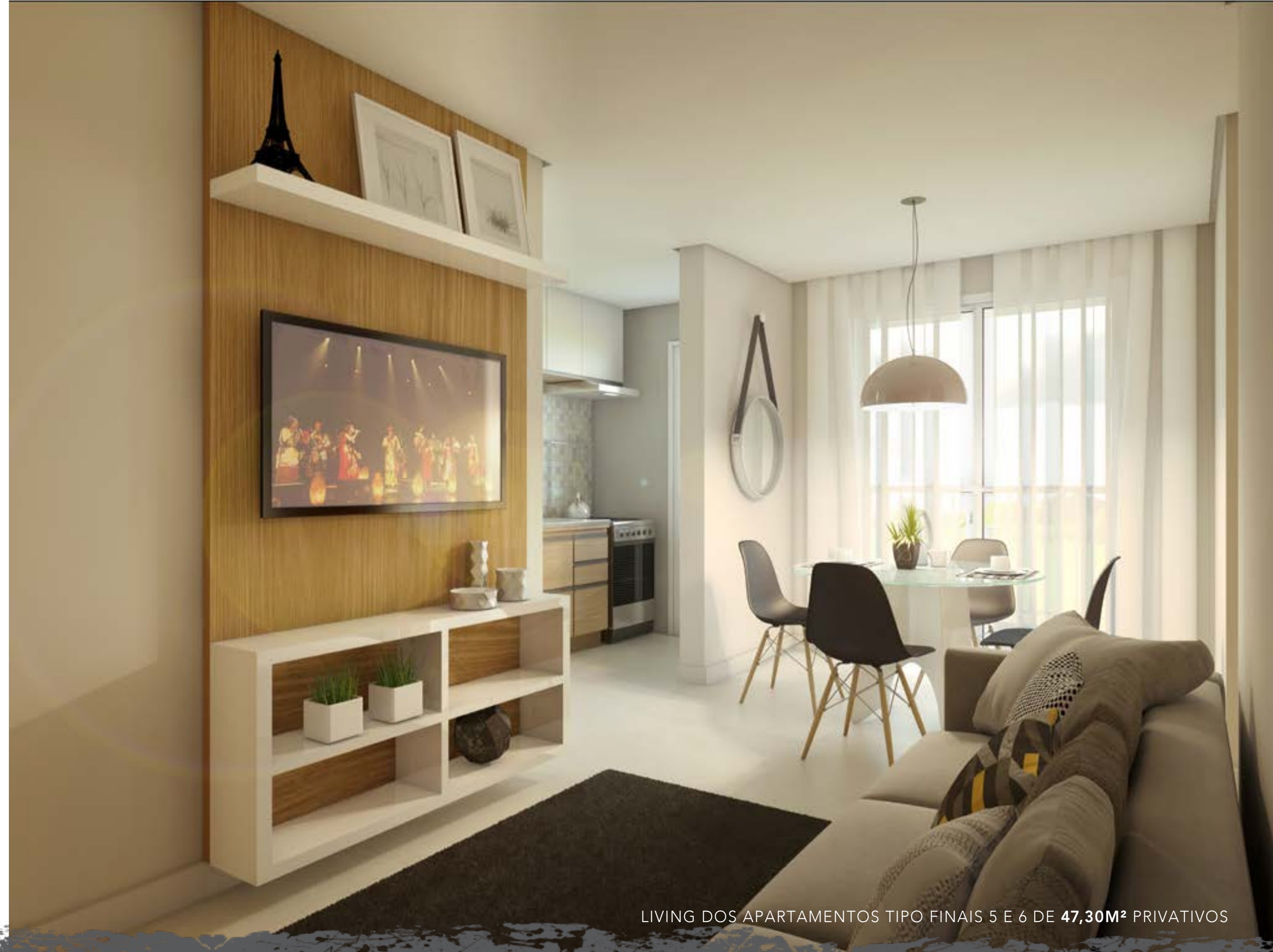
LIVING DOS APARTAMENTOS TIPO FINAIS 5 E 6 DE 47,30M 2 PRIVATIVOS

Ilustração artística da planta dos apartamentos tipos finais 5 e 6 de 47,30m 2 privativos. Todos os móveis, objetos, pisos, rodapés, molduras, sancas e alguns pontos de iluminação estão dentro dos parâmetros comerciais e servem somente como sugestões de decoração, não integrando o imóvel comercializado. Todos os detalhes de equipamentos e acabamentos que farão parte deste empreendimento constam no memorial descritivo. Visite o stand de vendas e conheça mais plantas do empreendimento. Material preliminar, sujeito a alteração. As medidas internas dos ambientes não estão contemplando os revestimentos.