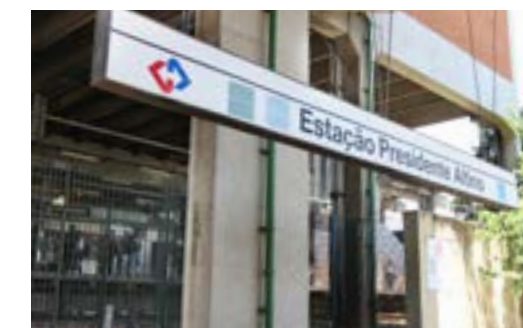
Estação Presidente Altino da CPTM