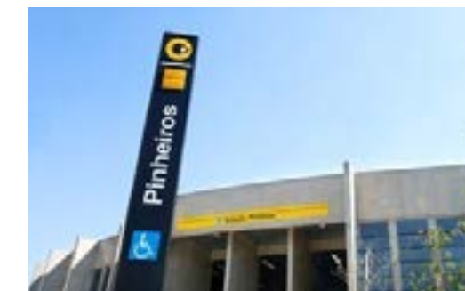
Estação do Metrô Pinheiros