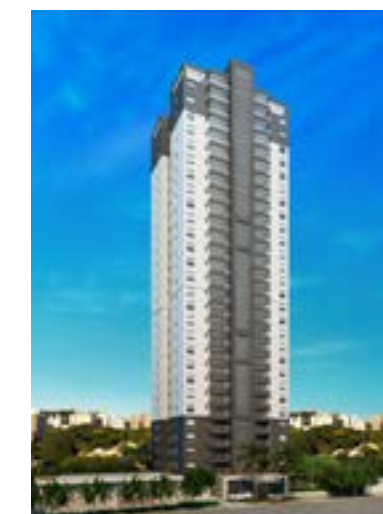
Soberano - Osasco/SP