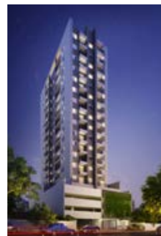
Residencial Estação 153 - Osasco/SP