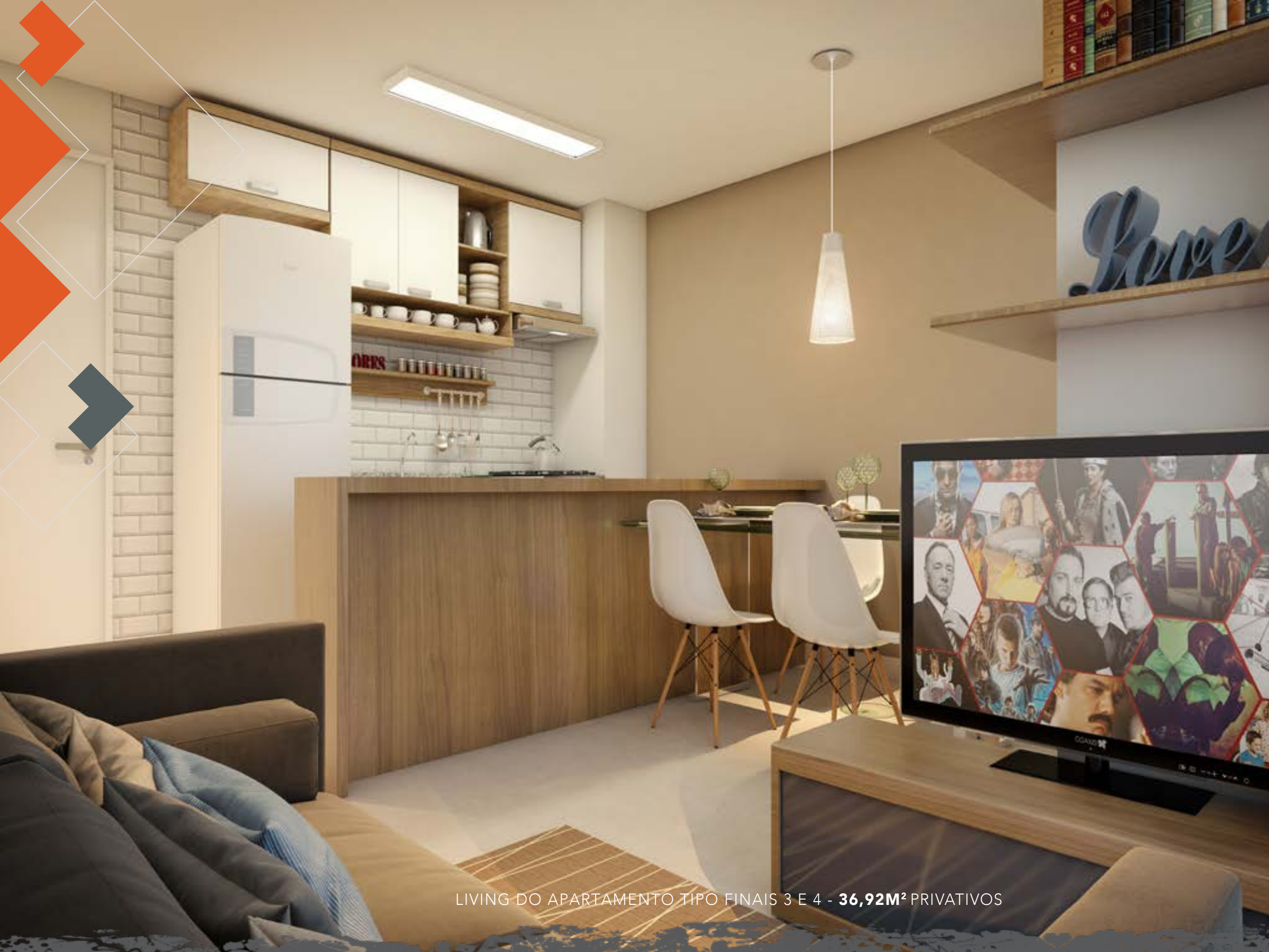
LIVING DO APARTAMENTO TIPO FINAIS 3 E 4 - 36,92M 2 PRIVATIVOS