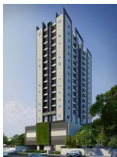
Residencial Estação 135 - Osasco/SP