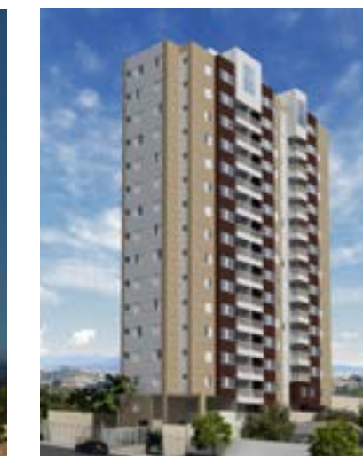
Florence - Osasco/SP