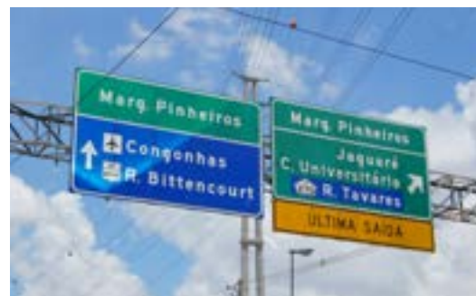
Cebolão - Marginais Tietê e Pinheiros