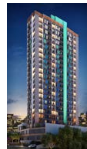
Croma Residencial - Osasco/SP