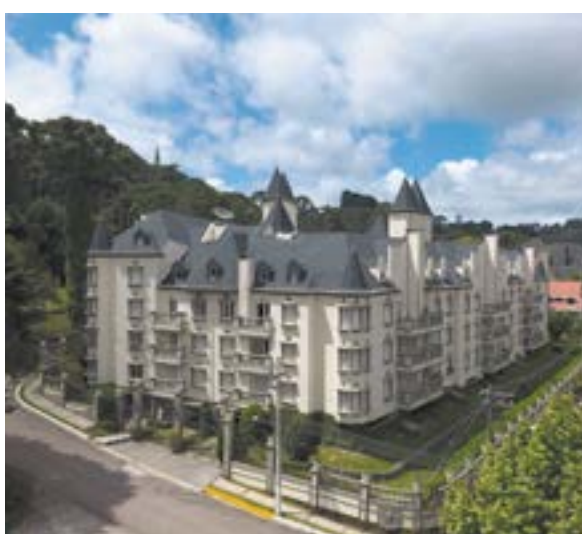
Chateau du Loire - Campos do Jordão/SP