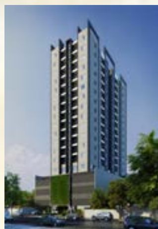
Residencial Estação 163 - Osasco/SP