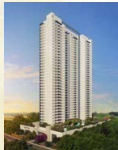
Acqua Park - Alphaville/SP