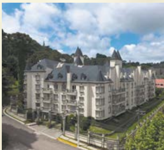
Chateau du Loire - Campos do Jordão/SP