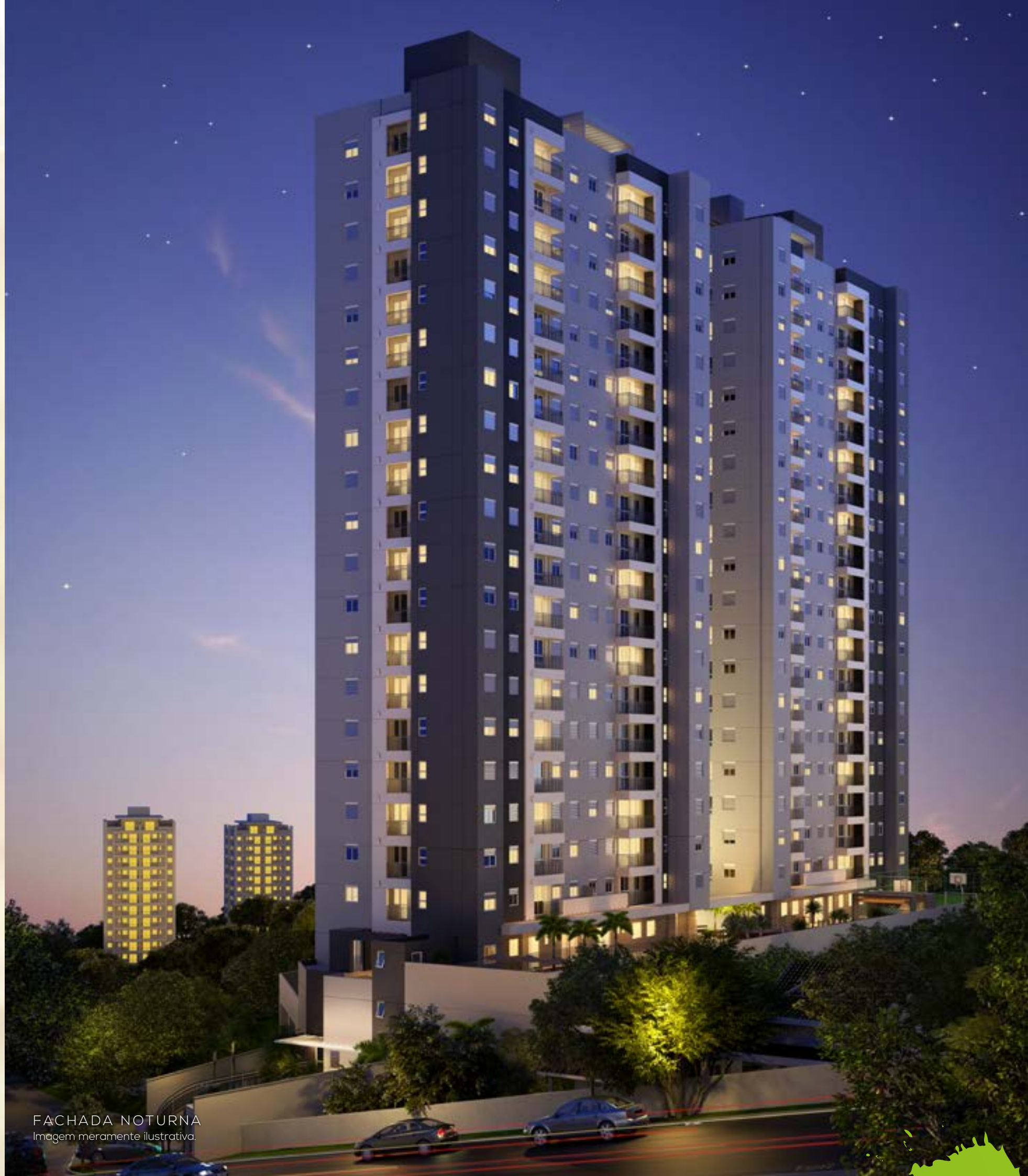
FACHADA NOTURNA Imagem meramente ilustrativa.