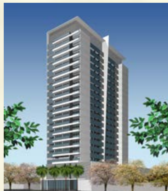
Ecco Tower - Guarulhos/SP