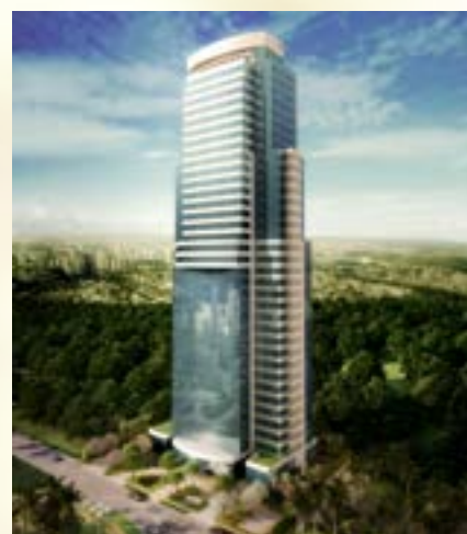
Air Office - Alphaville/SP