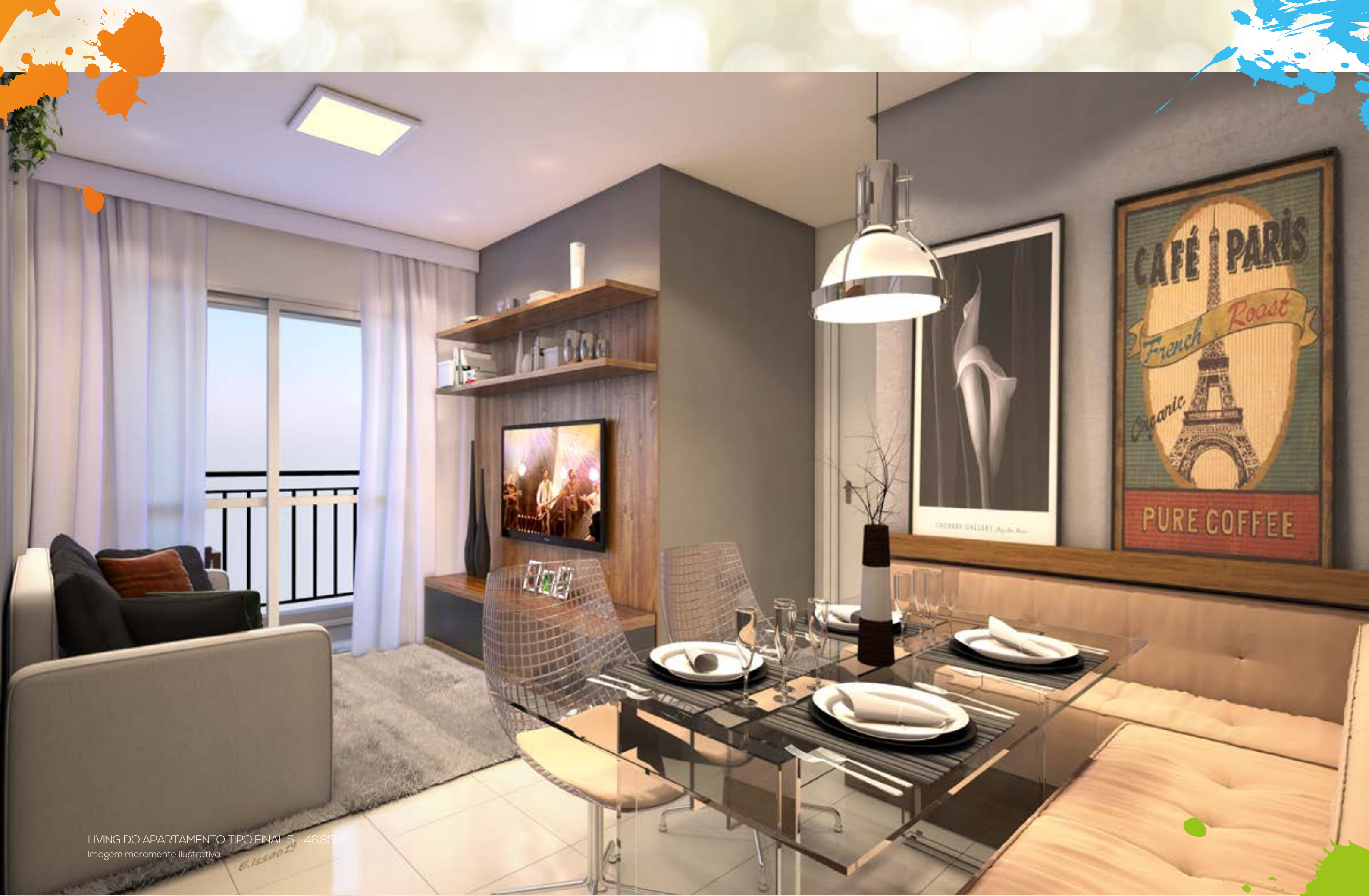
LIVING DO APARTAMENTO TIPO FINAL 5 - 46,85M 2 Imagem meramente ilustrativa.