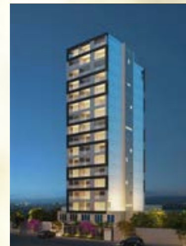
Stay - São Paulo/SP