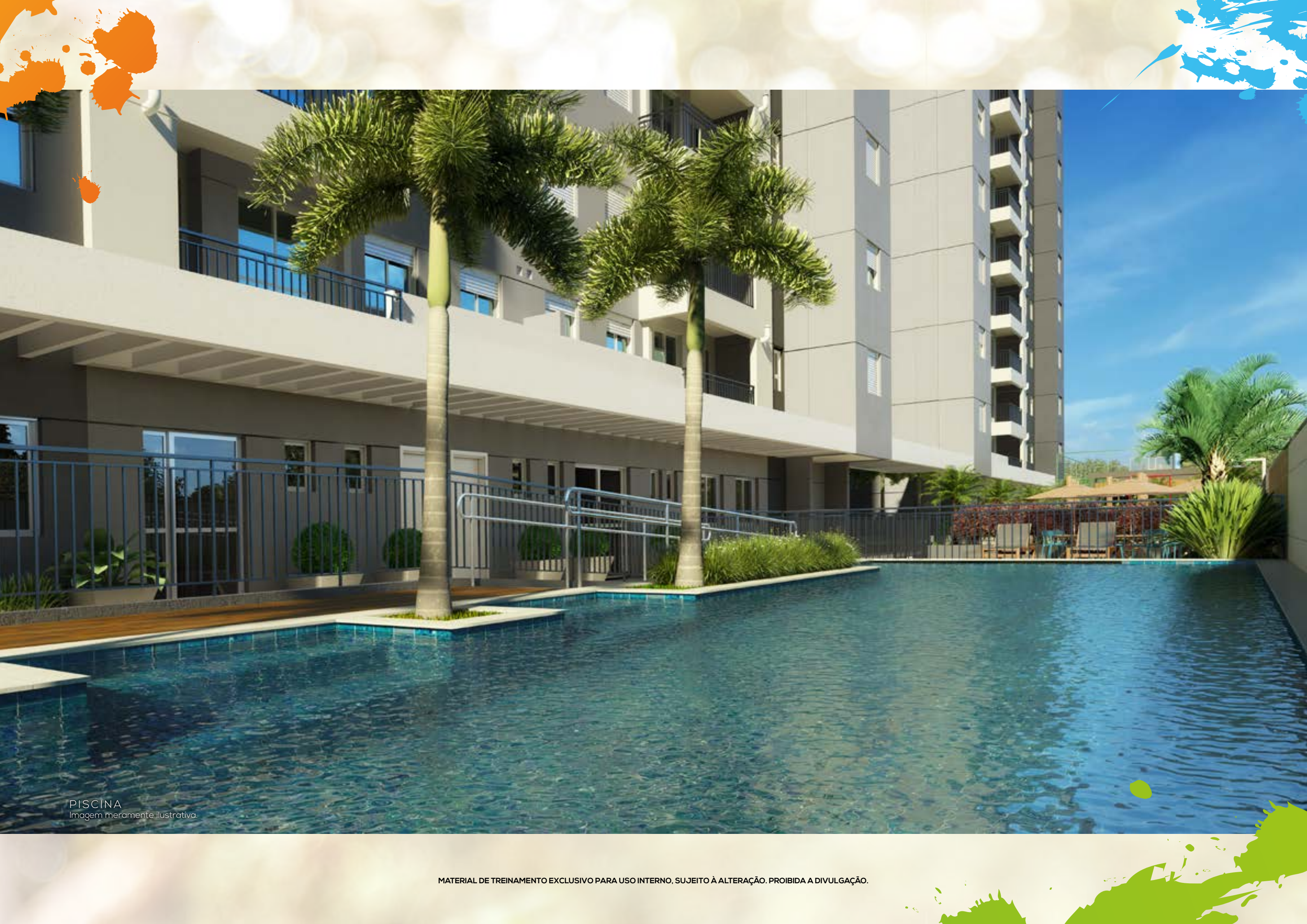
PISCINA Imagem meramente ilustrativa.