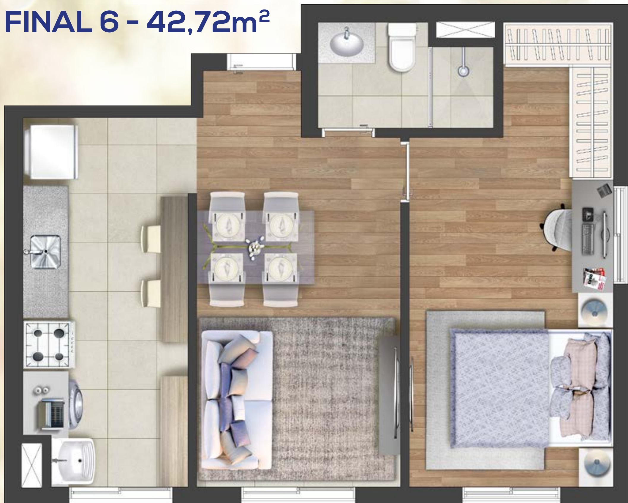
Ilustração artística da planta do apartamento final 6 - 42,72m 2 privativos. Todos os móveis, objetos, pisos, rodapés, molduras, sanças e alguns pontos de iluminação estão dentro dos parâmetros comerciais e servem somente como sugestões de decoração, não integrando o imóvel comercializado. Todos os detalhes de equipamentos e acabamentos que farão parte deste empreendimento constam no memorial descritivo. Visite o stand de vendas e conheça mais plantas do empreendimento. As medidas internas dos ambientes não estão contemplando os revestimentos.