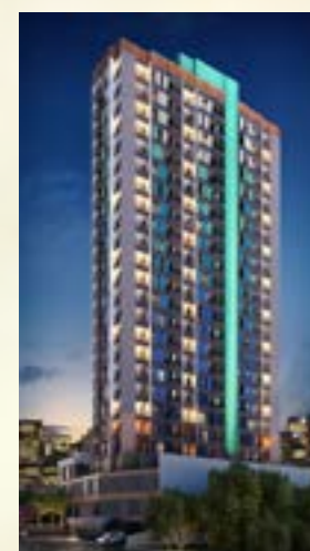
Croma Residencial - Osasco/SP