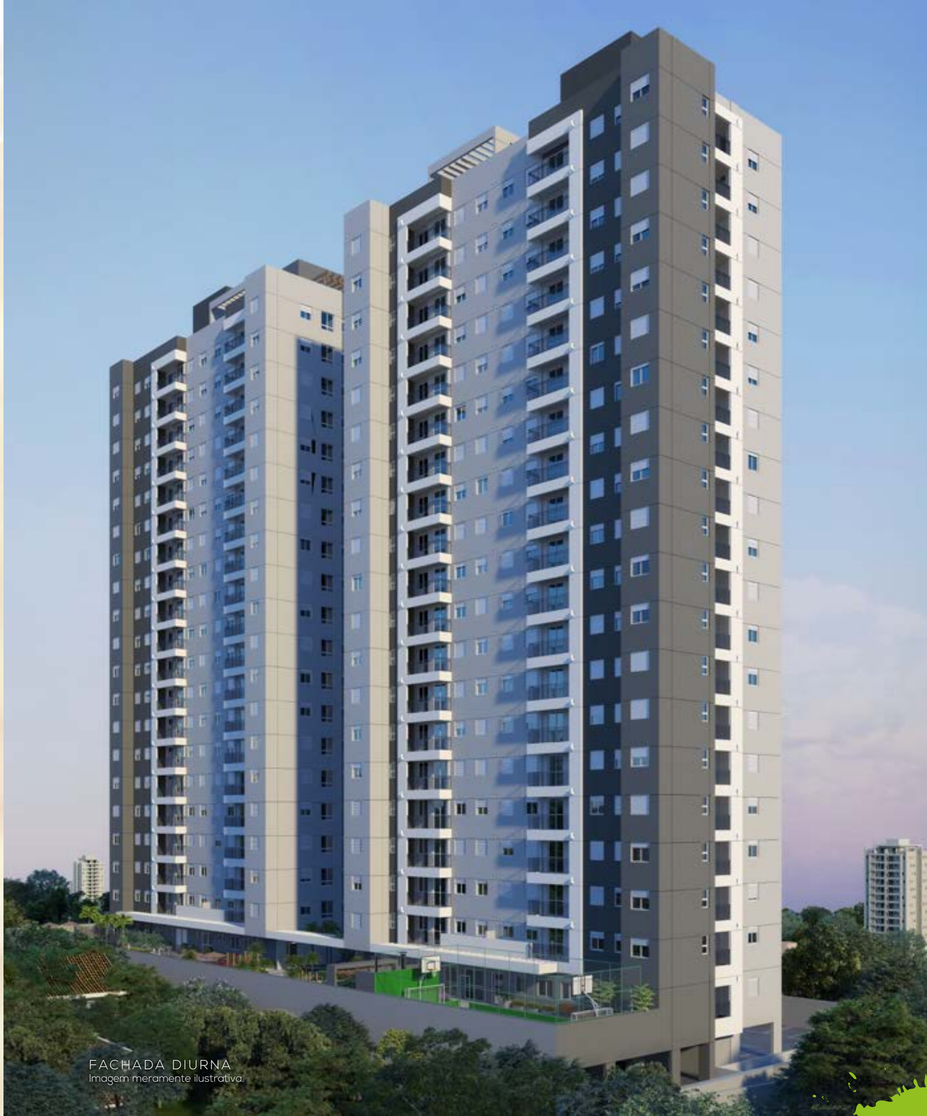
FACHADA DIURNA Imagem meramente ilustrativa.