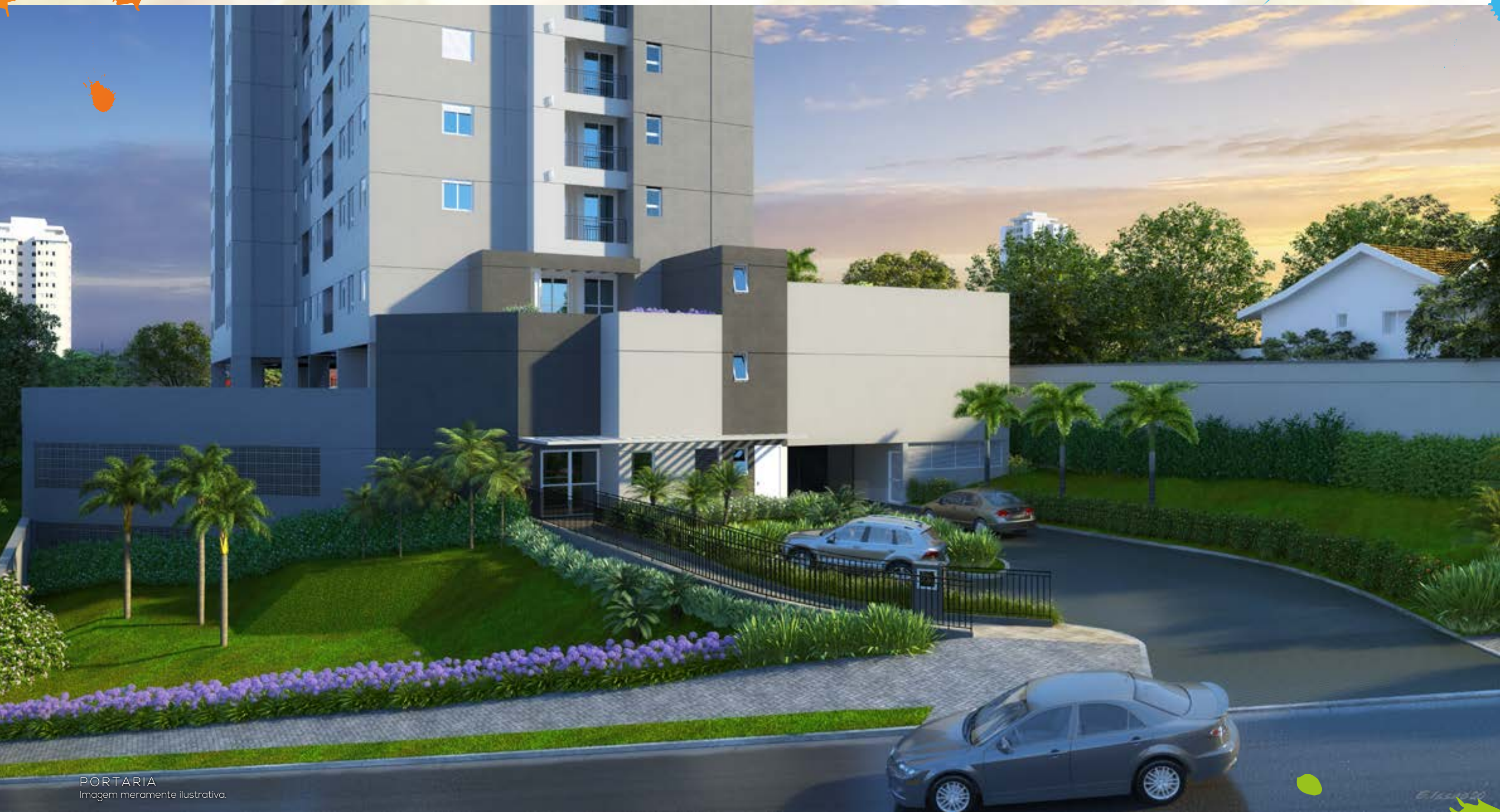
PORTARIA Imagem meramente ilustrativa.