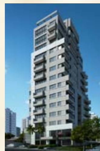
Smart Office - Alphaville/SP