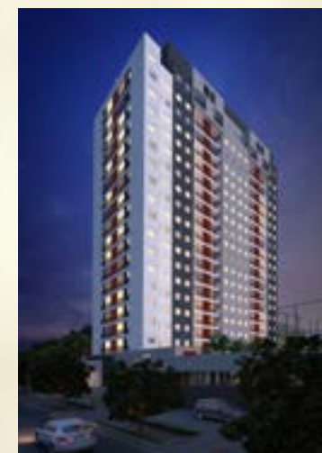
Estação 267 - Barueri/SP