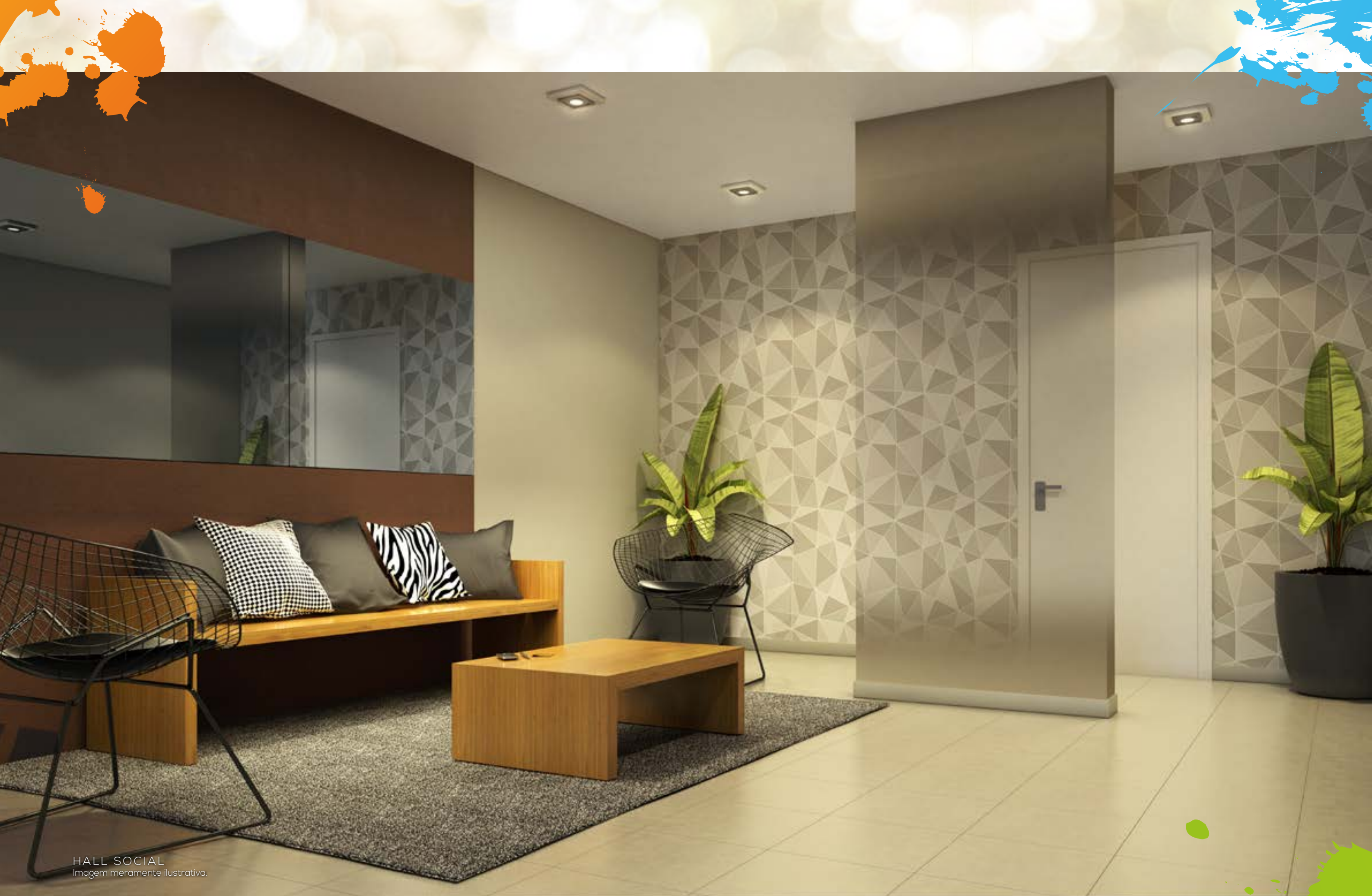
HALL SOCIAL Imagem meramente ilustrativa.