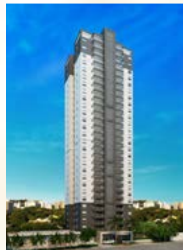
Soberano - Osasco/SP