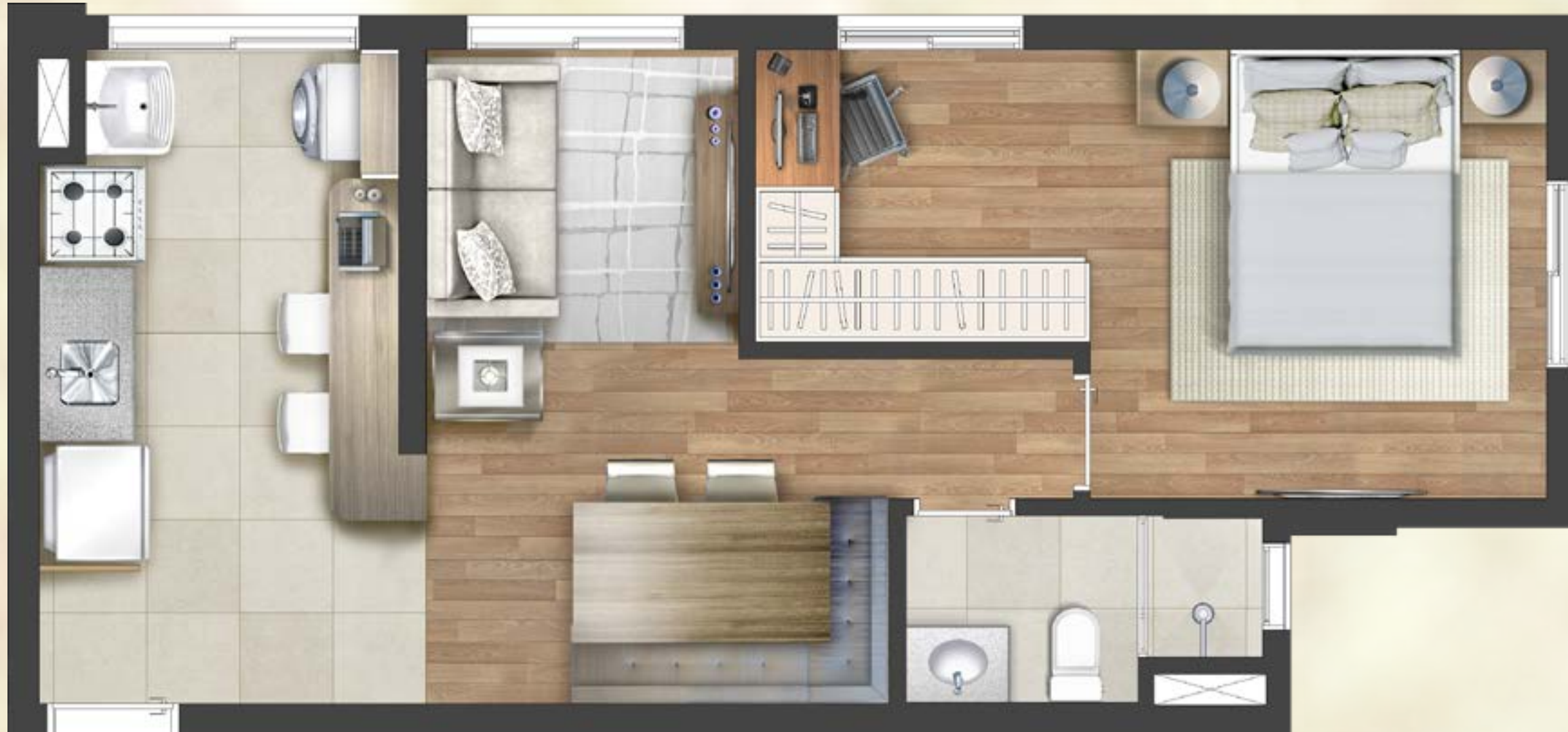
Ilustração artística da planta do apartamento final 2 - 42,63m 2 privativos. Todos os móveis, objetos, pisos, rodapés, molduras, sancas e alguns pontos de iluminação estão dentro dos parâmetros comerciais e servem somente como sugestões de decoração, não integrando o imóvel comercializado. Todos os detalhes de equipamentos e acabamentos que farão parte deste empreendimento constam no memorial descritivo. Visite o stand de vendas e conheça mais plantas do empreendimento. As medidas internas dos ambientes não estão contemplando os revestimentos.