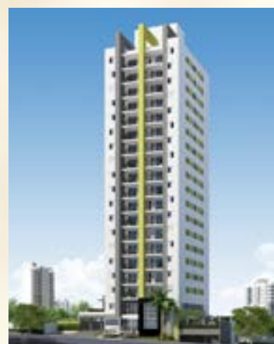
Mirante Rochdale - Osasco/SP