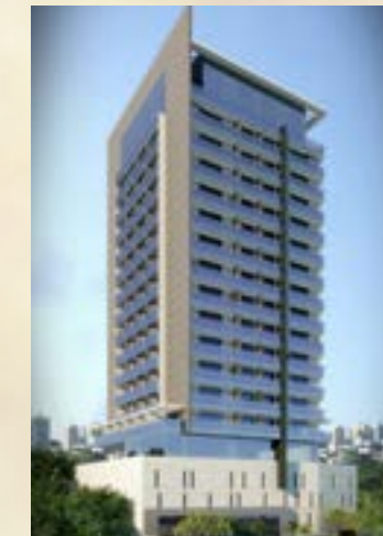
Campesina - Osasco/SP