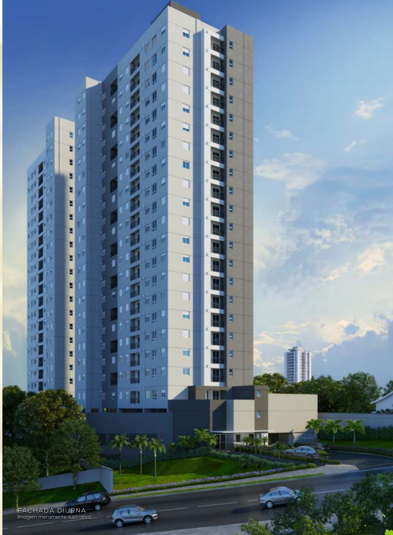
FACHADA DIURNA Imagem meramente ilustrativa.