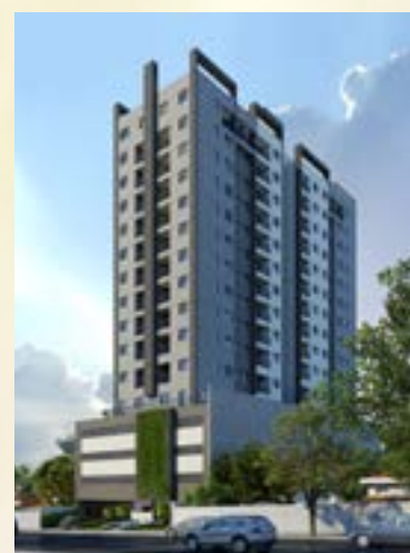
Residencial Estação 348 - Osasco/SP