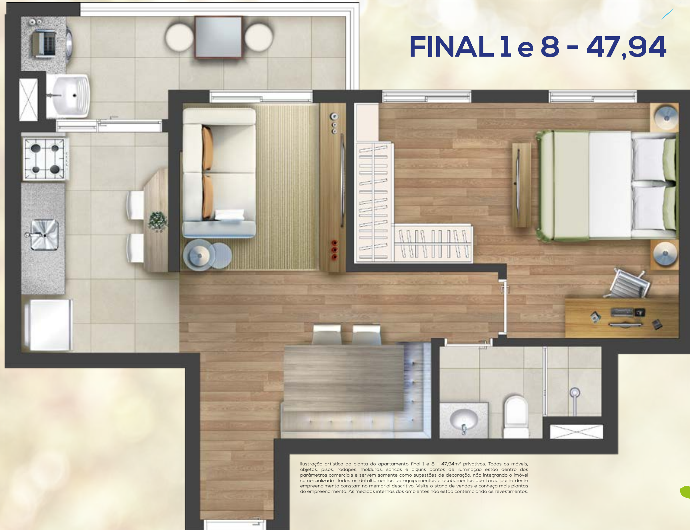
Ilustração artística da planta do apartamento final 1 e 8 - 47,94m 2 privativos. Todos os móveis, objetos, pisos, rodapés, molduras, sancas e alguns pontos de iluminação estão dentro dos parâmetros comerciais e servem somente como sugestões de decoração, não integrando o imóvel comercializado. Todos os detalhamentos de equipamentos e acabamentos que farão parte deste empreendimento constam no memorial descritivo. Visite o stand de vendas e conheça mais plantas do empreendimento. As medidas internas dos ambientes não estão contemplando os revestimentos.