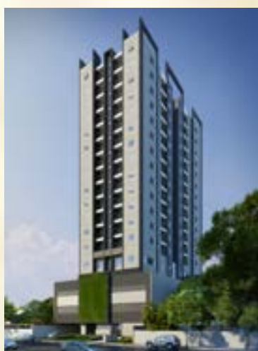
Residencial Estação 135 - Osasco/SP