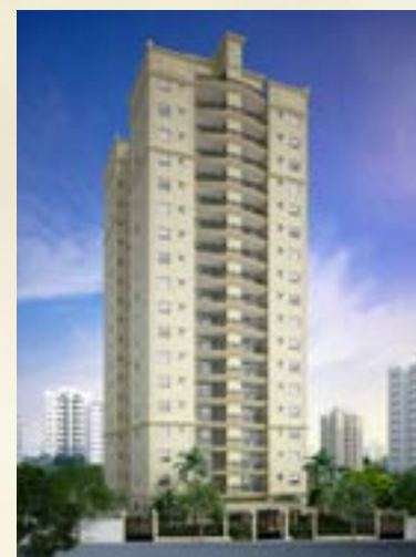
Waldorf Residence - Santana/SP