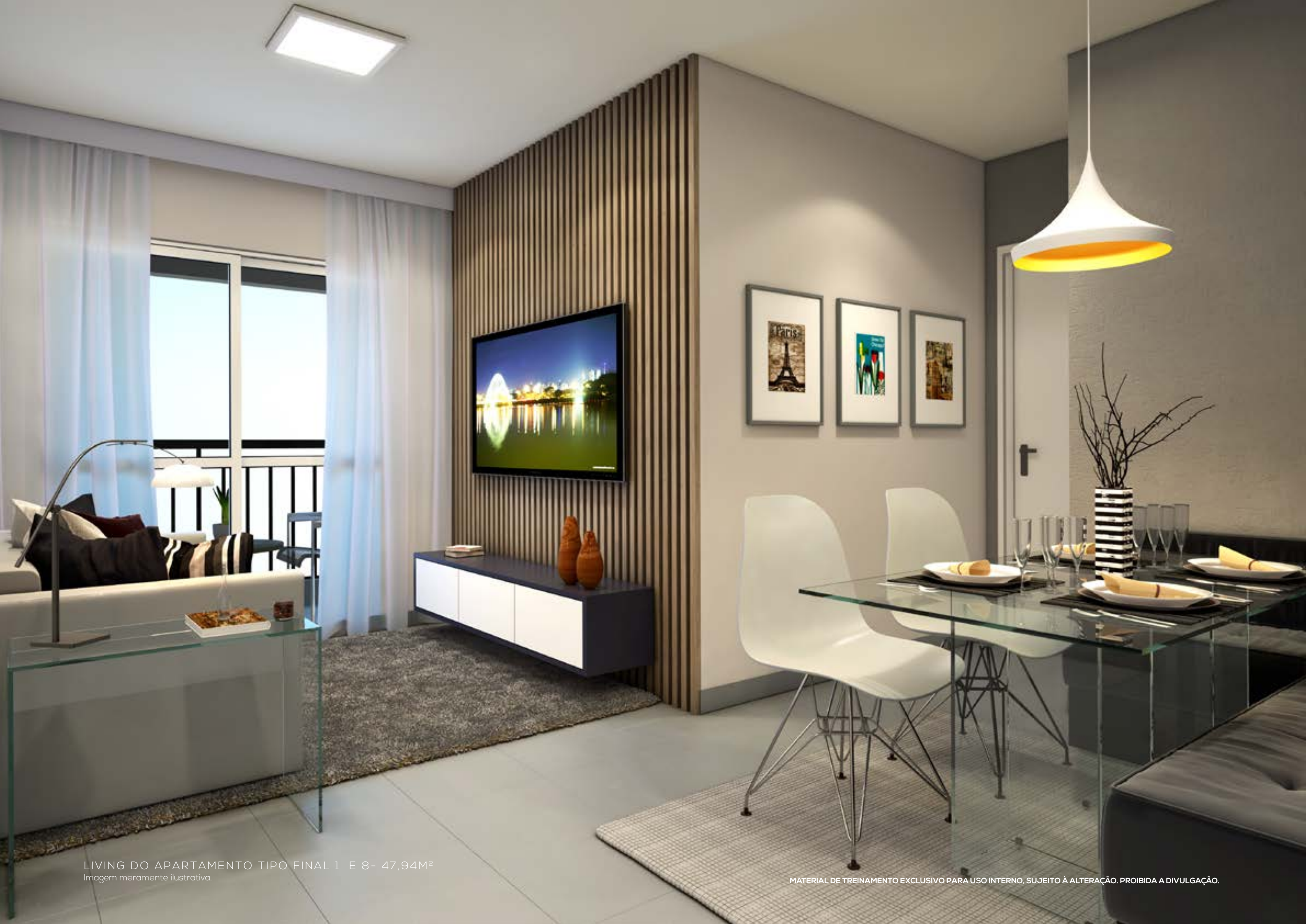
LIVING DO APARTAMENTO TIPO FINAL 1 E 8- 47,94M 2 Imagem meramente ilustrativa.

MATERIAL DE TREINAMENTO EXCLUSIVO PARA USO INTERNO, SUJEITO À ALTERAÇÃO. PROIBIDA A DIVULGAÇÃO.