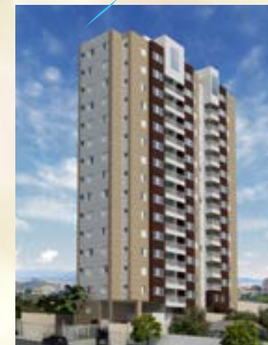
Florence - Osasco/SP