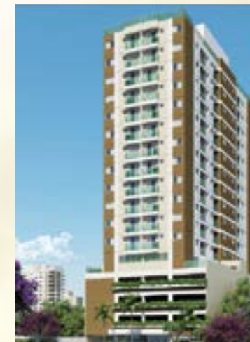
Brecheret - Osasco/SP