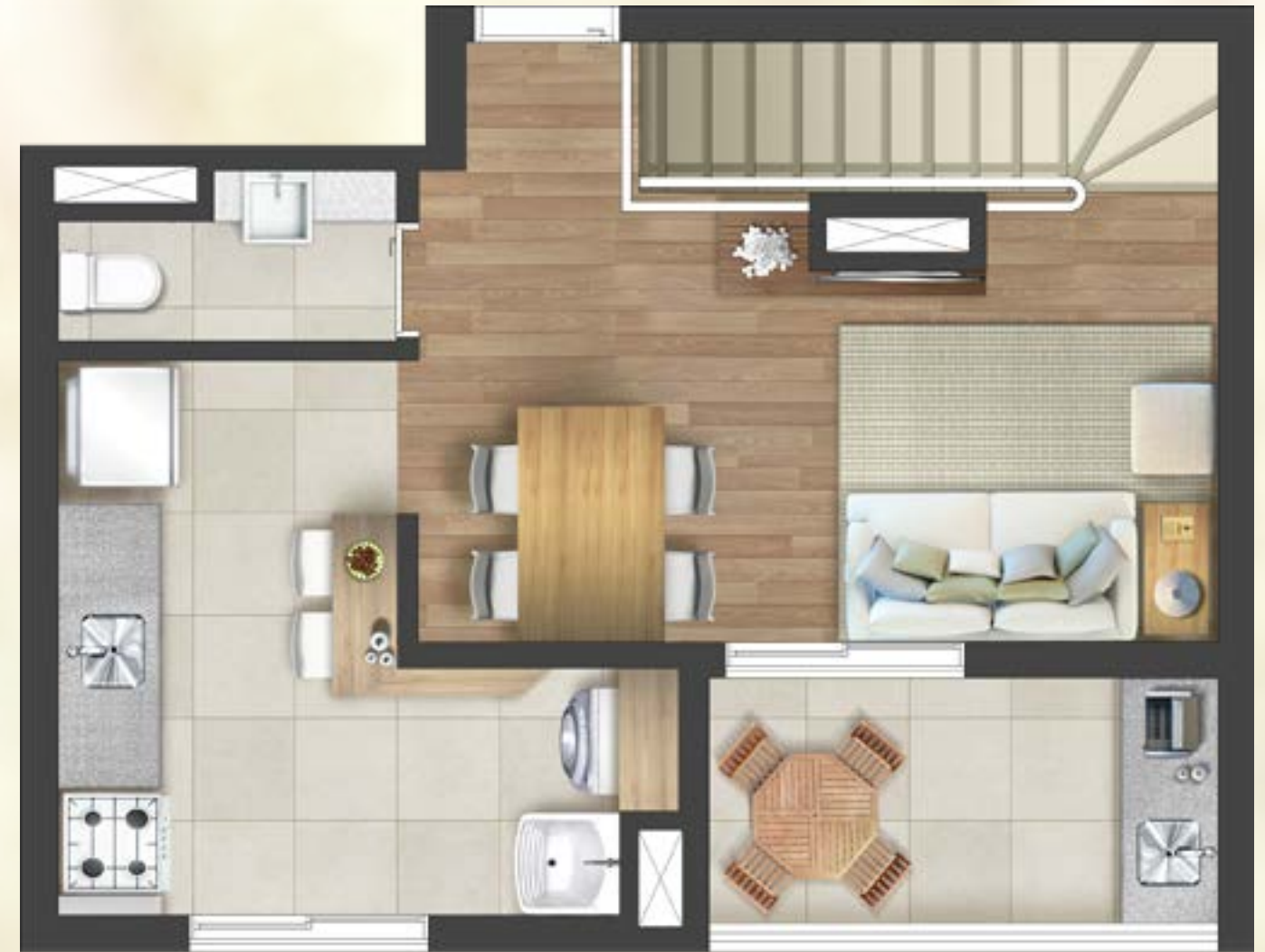
Ilustração artística da planta do apartamento duplex pavimento superior final 4 - 68,92m 2 privativos. Todos os móveis, objetos, pisos, rodapés, molduras, sancas e alguns pontos de iluminação estão dentro dos parâmetros comerciais e servem somente como sugestões de decoração, não integrando o imóvel comercializado. Todos os detalhes de equipamentos e acabamentos que farão parte deste empreendimento constam no memorial descritivo. Visite o stand de vendas e conheça mais plantas do empreendimento. As medidas internas dos ambientes não estão contemplando os revestimentos.