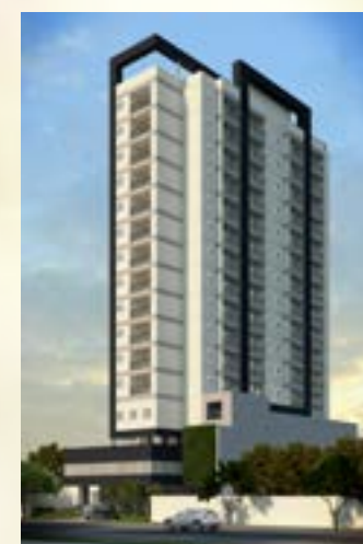
Residencial Estação 235 - Osasco/SP