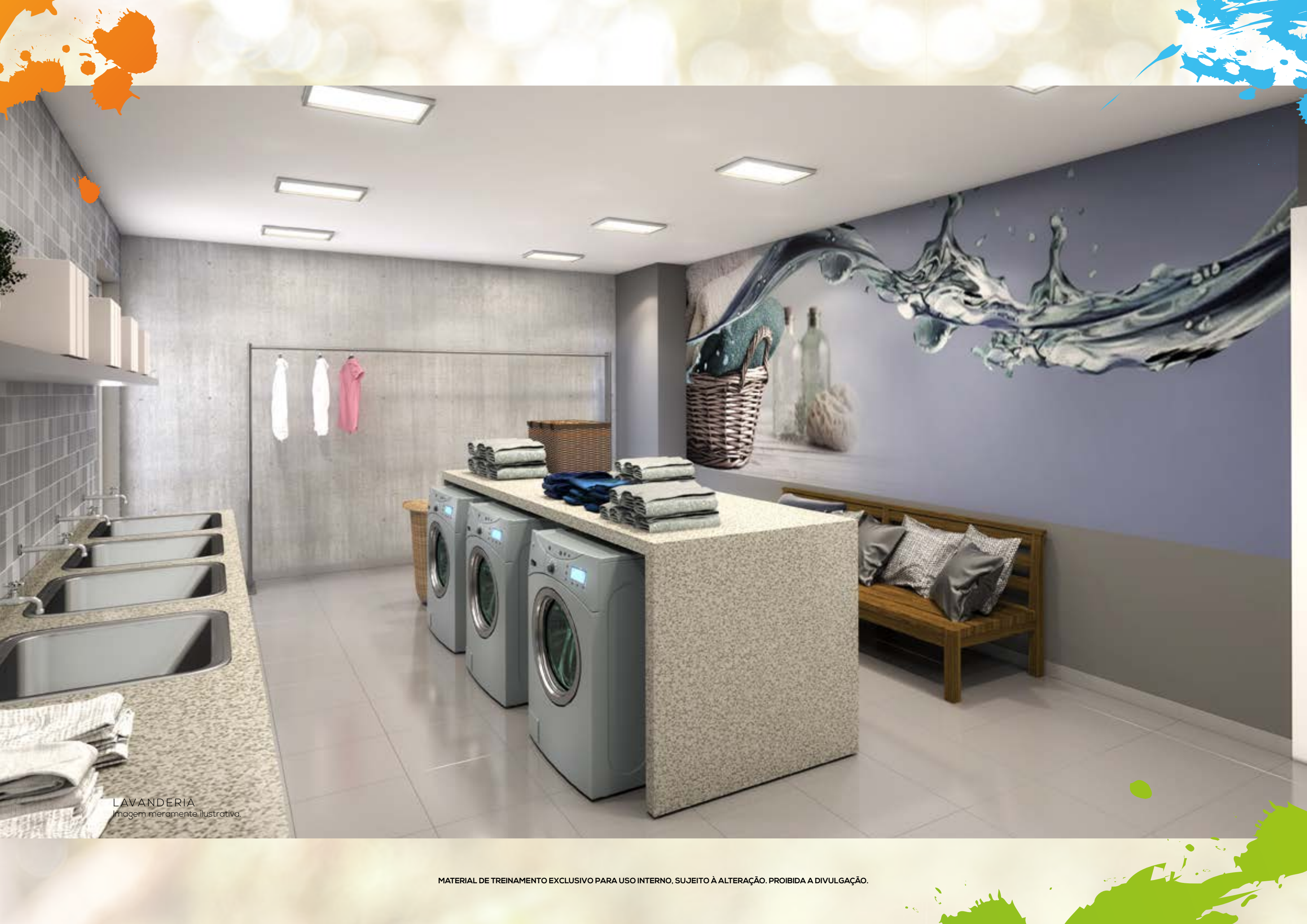
LAVANDERIA Imagem meramente ilustrativa.