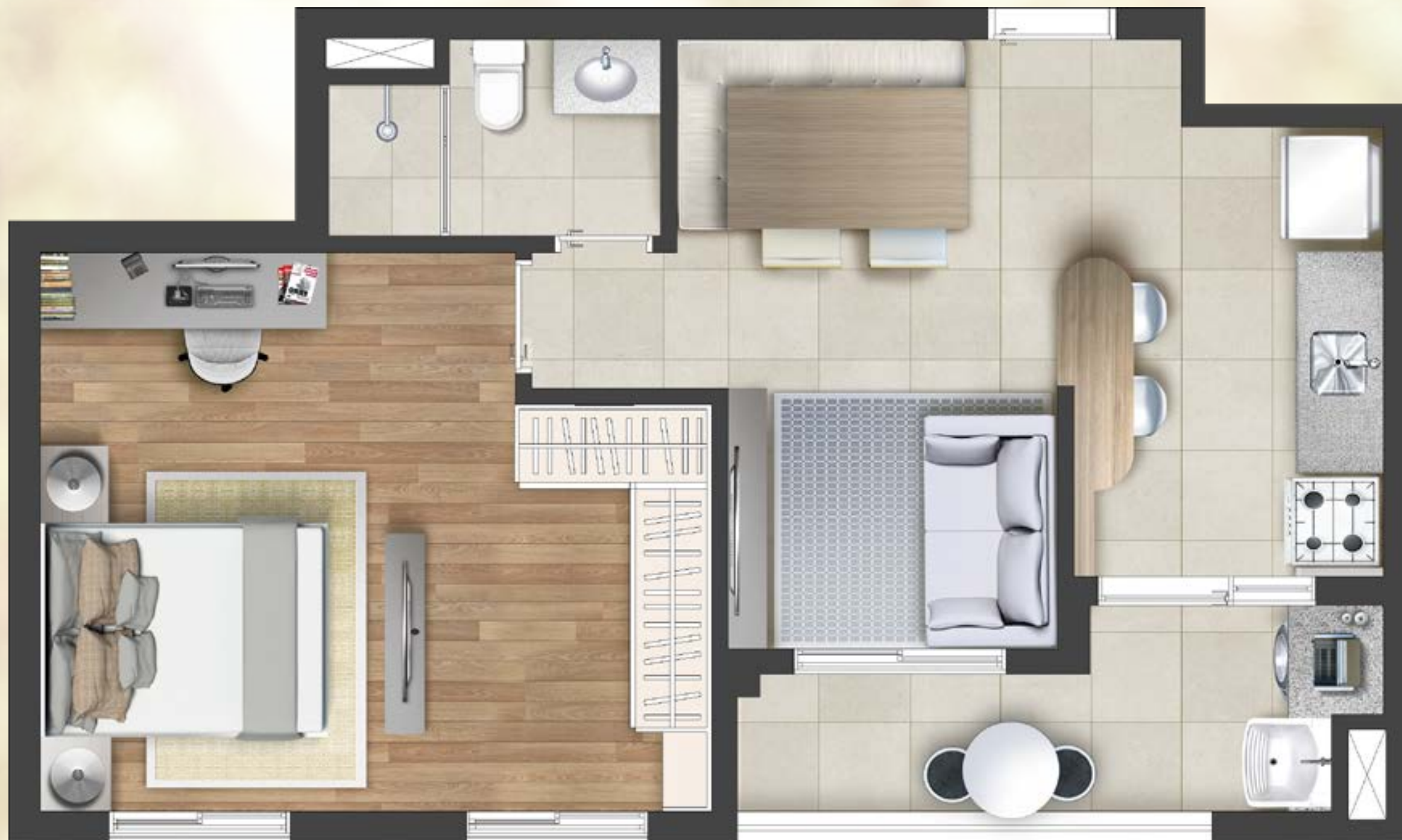
Ilustração artística da planta do apartamento final 5 - 46,85m 2 privativos. Todos os móveis, objetos, pisos, rodapés, molduras, sanças e alguns pontos de iluminação estão dentro dos parâmetros comerciais e servem somente como sugestões de decoração, não integrando o imóvel comercializado. Todos os detalhes de equipamentos e acabamentos que farão parte deste empreendimento constam no memorial descritivo. Visite o stand de vendas e conheça mais plantas do empreendimento. As medidas internas dos ambientes não estão contemplando os revestimentos.