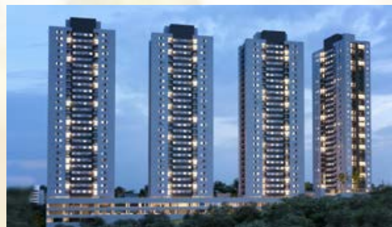
Residencial Viva Clube - Carapicuíba/SP