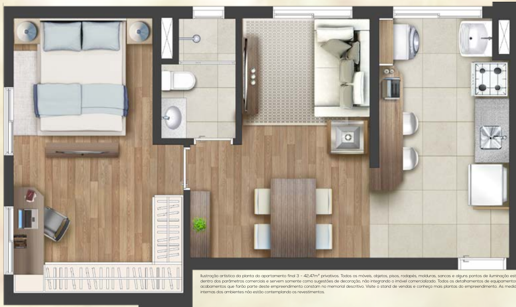
Ilustração artística da planta do apartamento final 3 - 42,47m 2 privativos. Todos os móveis, objetos, pisos, rodapés, molduras, sancas e alguns pontos de iluminação estão dentro dos parâmetros comerciais e servem somente como sugestões de decoração, não integrando o imóvel comercializado. Todos os detalhes de equipamentos e acabamentos que farão parte deste empreendimento constam no memorial descritivo. Visite o stand de vendas e conheça mais plantas do empreendimento. As medidas internas dos ambientes não estão contemplando os revestimentos.