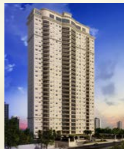
Bellagio - Alphaville/SP