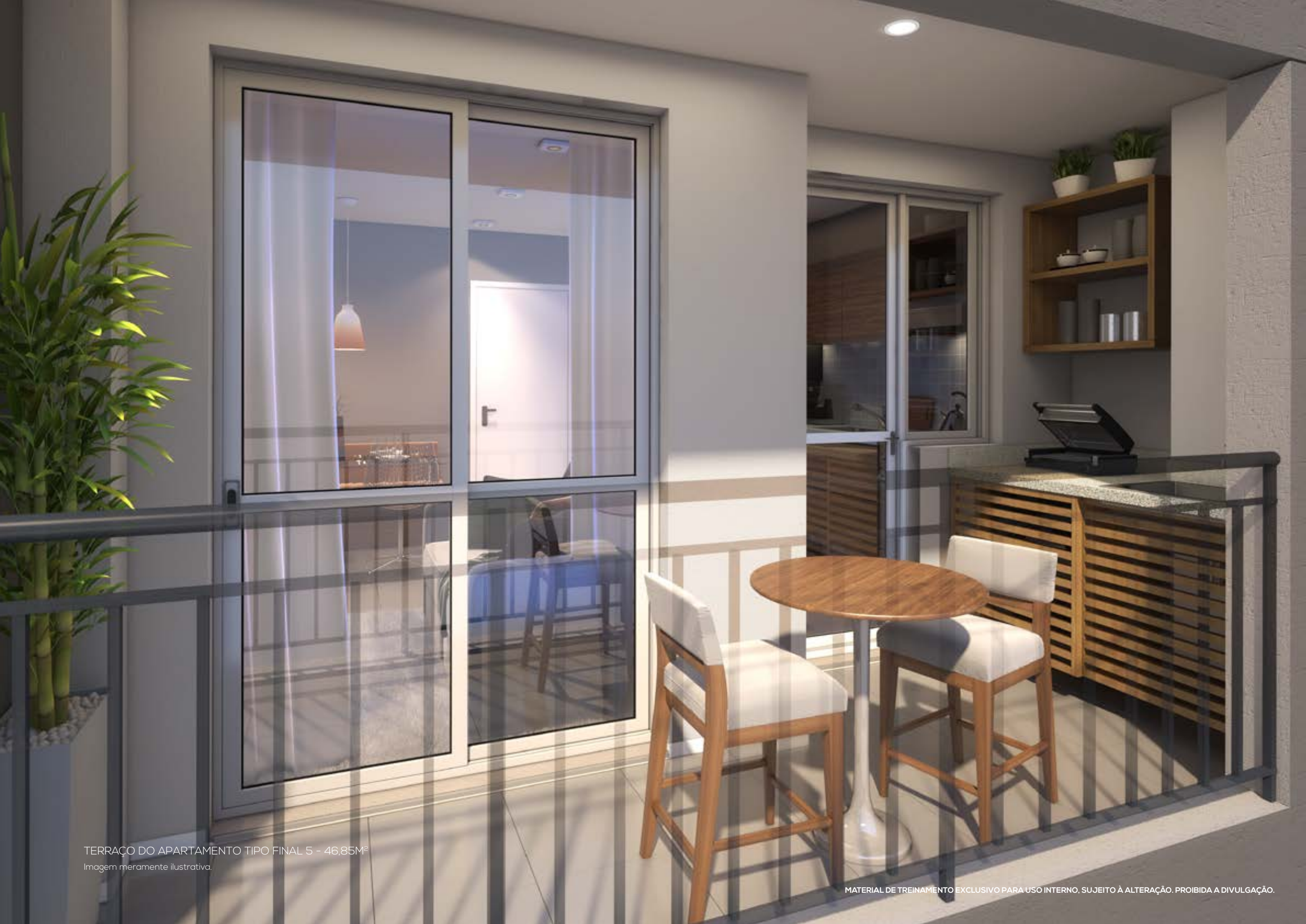
TERRAÇO DO APARTAMENTO TIPO FINAL 5 - 46,85M 2 Imagem meramente ilustrativa.