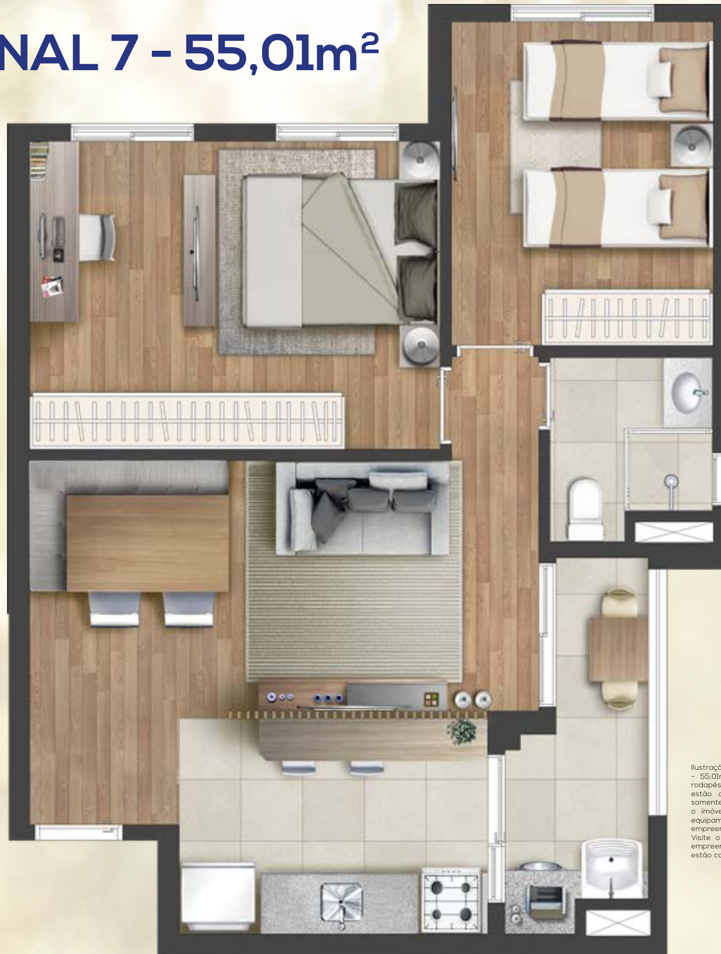
Ilustração artística da planta do apartamento final 7 - 55,01m 2 privativos. Todos os móveis, objetos, pisos, rodapés, molduras, sanças e alguns pontos de iluminação estão dentro dos parâmetros comerciais e servem somente como sugestões de decoração, não integrando o imóvel comercializado. Todos os detalhes de equipamentos e acabamentos que farão parte deste empreendimento constam no memorial descritivo. Visite o stand de vendas e conheça mais plantas do empreendimento. As medidas internas dos ambientes não estão contemplando os revestimentos.