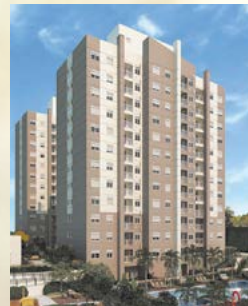
Soleil Residencial Resort - Bragança Paulista/SP