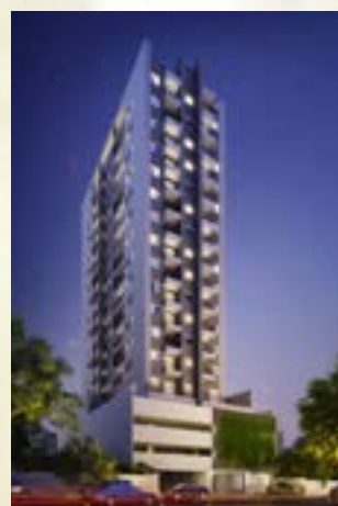
Residencial Estação 153 - Osasco/SP