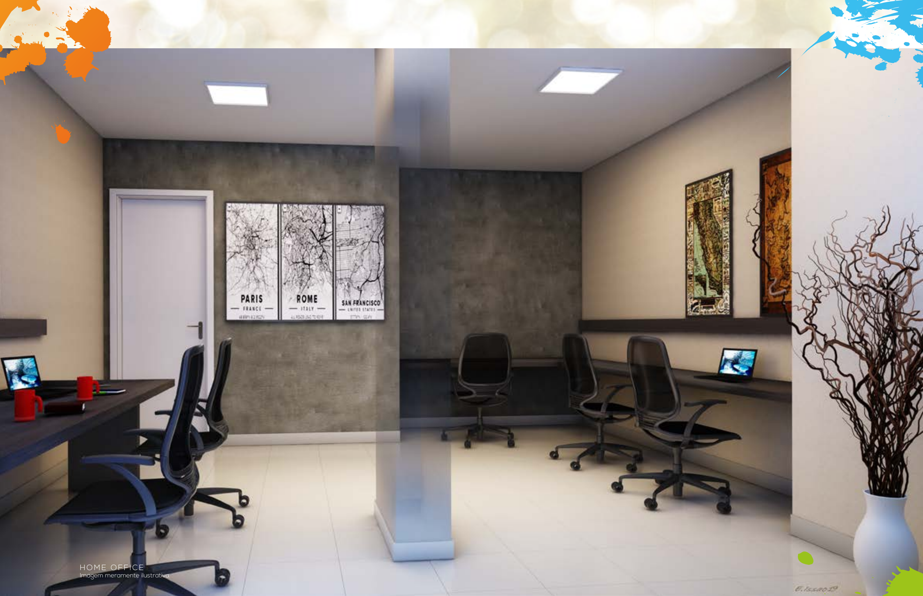
HOME OFFICE Imagem meramente ilustrativa.