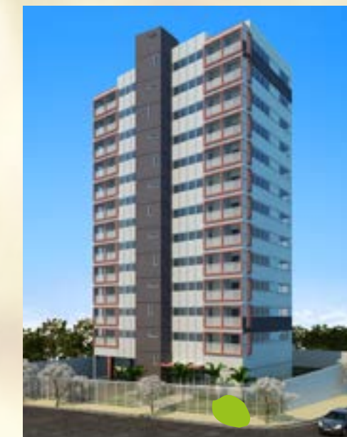
Plaza Office - São Paulo/SP